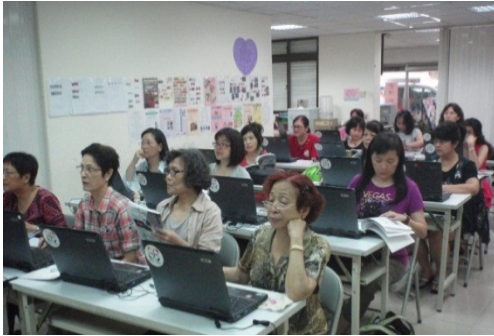
註：永和亞太勞動人權促進協會-婦女班

市民免費電腦課程，隨著時代腳步，課程內容不斷推陳出新，先後開設有平板電腦、智慧手機、電腦基礎、網路電子相簿、社群分享(Facebook、Line)、網路拍賣、文書處理…等多種課程，推出至今廣受市民青睞，好評不斷，民眾滿意度超過九成五。