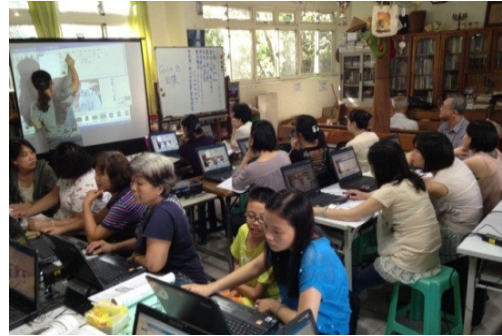
註：新店喜樂浸信會-婦女班

依 100 年至 104 年度參與學員性別比率分析(表 2)，女性比率達 70%以上，顯示女性市民對市民免費電腦課程之接受度較高且對提升本身電腦或網路使用能力之需求較高。