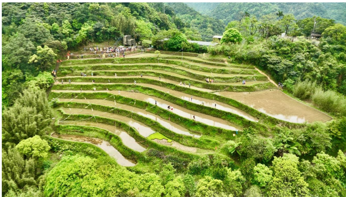
圖 4-4 插秧大賽—學校後方梯田成為賽區（簡佩瑜提供，2025）