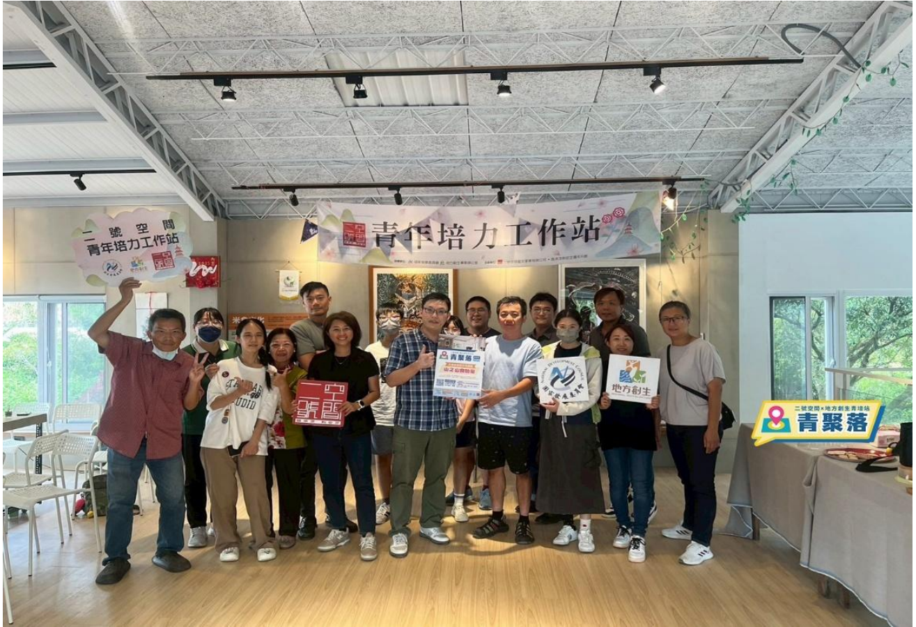
圖 4-2 二號空間青年培力工作站夥伴合照(江玉誠提供，2025)

梯田農業與景觀資源、地方品牌再造、青年返鄉與創業支持、文化資產與空間活化，以及智慧農業與觀光整合行銷等策略，以強化區域資源串聯與整體推動能量。