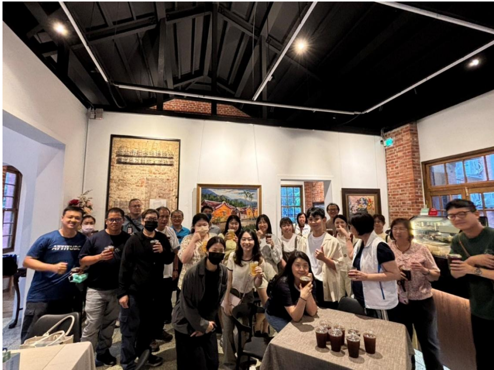
圖 4-5 114 年地方創生培力坊—深坑場