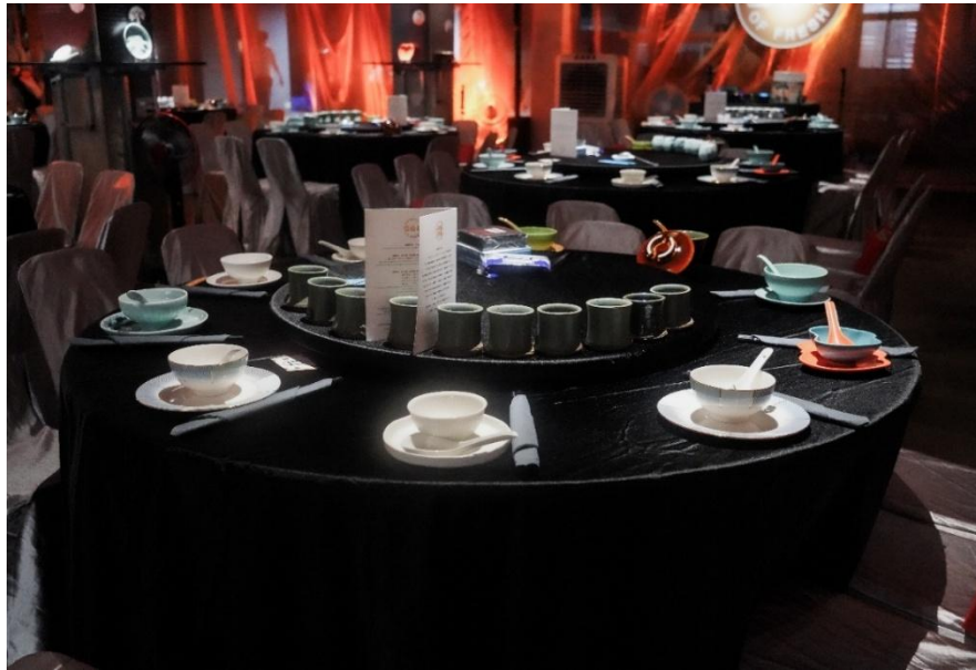
圖 4-3 鶯歌宴桌案現場（吳佳樺提供，2025）

新北市陶瓷瓦代代合作會在前述計畫的基礎下，已在著手「Yinggooo 鶯歌地域品牌永續發展計畫」2.0，目前已撰擬完成計畫，中央部會初步審核中，將由地方創生北區輔導中心協助，預計 2026 年上半年提出。