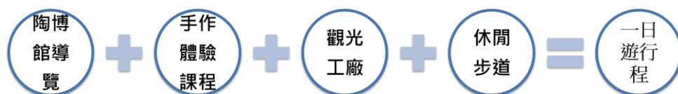
圖 2：「週二樂齡砌陶趣」一日遊活動模式圖

此活動的設計基礎，包括：結伴出遊玩陶、多元體驗活動、長者閒餘時間。活動通常設計為一日遊，依照體驗活動所需的時間、長者的體力來規劃。例如鄰近的醬油工廠、溫泉休閒區、三峽藍染、鶯歌陶藝工廠等，都是合作之衛星單位。